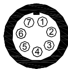
Pinout connettore Binder 712 - 7 pin maschio vista lato saldatura